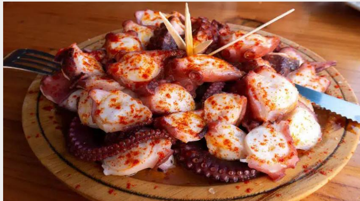
octopus fair style ('pulpo á feira')