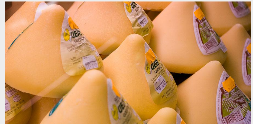
Queixo de Tetilla 路过Arzúa必须尝一下