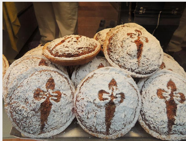
Tarta de Santiago